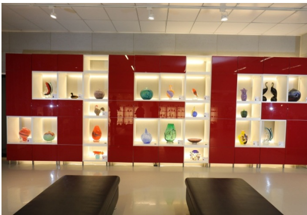
(春池「亮彩琉璃」)

瑞士的洛桑管理學院把廢玻璃的回收再利用率，作為國家競爭力的指標之一，台灣玻璃回收率居全球第二，僅次於瑞典。身為台灣最大的玻璃回收廠，春池玻璃一年的回收量約 10 萬噸，佔台灣回收玻璃的 7 成，減少的碳排放量也相當於蓋了 500 座大安森林公園。台灣春池從傳統的回收業，到研發出全球首創以電腦面板玻璃廢料為原料的「亮彩琉璃」的綠建材以及節能磚，以回收廢玻璃做成台灣版的施華洛世奇，外銷全世界。