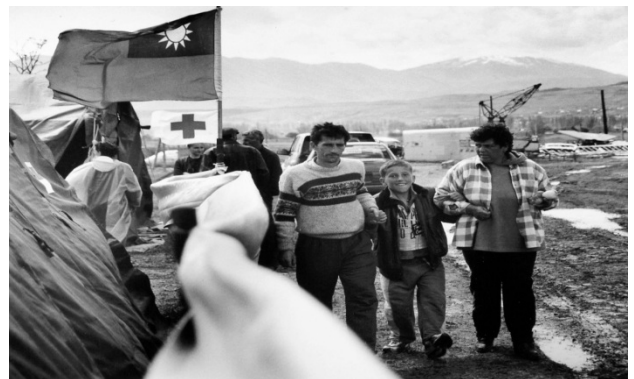
(台灣路竹會在馬其頓醫療救援)

我國自 80 年代起即積極參與國際災難人道援助行動，提供醫療、衛生、救濟物資及重建等協助，國際社會於我國 921 大地震的紛紛馳援，讓國人更加積極參加國際災難救援工作，回饋國際社會。據統計，我國政府及民間迄今在國際人道援助所投入的金錢、人力及物資至少超過 10 億美元以上，在全球各重大災難現場不僅都可看到台灣人的愛心及感人事蹟，捐輸更不落人後。