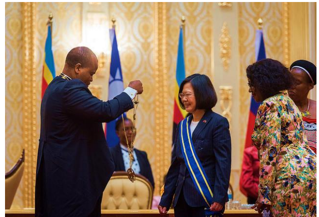
(蔡總統出訪史瓦濟蘭會晤恩史瓦帝三世國王並獲贈象王勳章)

的50歲生日，並且今年也是臺灣和史瓦濟蘭建交五十週年。走過互信互助的五十年，蔡總統相信臺灣和史瓦濟蘭之間的合作互惠互信也會長長久久。蔡總統並指出，未來台史將在擴大技術交流及在互助互惠的基礎上，全面深化合作關係。