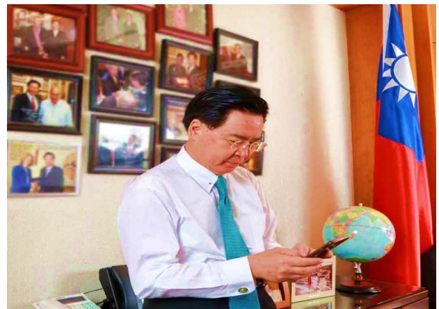
(臺灣外交部長吳釗燮親自撰寫首篇推文)

台灣外交部於 4 月 16 日正式設立推特(Twitter)帳號，吳部長釗燮親自撰寫首篇推文，向國際社會發聲。吳部長在推文中說到，「我很榮幸為外交部開啟全球即時溝通的新時代；對外交部來說，讓世界各地的朋友和夥伴們，能夠隨時瞭解臺灣外交事務的最新發展是非常重要的工作」。外交部推特將以國際社會為主要對象， Twitter 帳號: MOFA_TAIWAN ，歡迎大家追蹤。