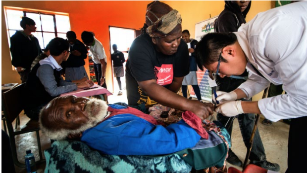
(台北醫學大學在史瓦濟蘭診療)

聯合國永續發展目標設定了在 2030 年消除愛滋病、肺結核、瘧疾、被忽略的熱帶傳染性疾病及肝炎等傳染性疾病，並減少非成年因非傳染性疾病的死亡率。為對抗這些重大疾病，多年來臺灣在非洲、亞洲、中南美洲及南太平洋地區等 20 餘國，分別針對愛滋病、肺結核、瘧疾、禽流感、伊波拉、MERS、茲卡、登革熱、乳癌、慢性腎衰竭等疾病進行超過 50 項以上的防治計畫。台灣自 2006 年總共派出超過 100 團次行動醫療團前往非洲、中南美洲、東南亞及太平洋地