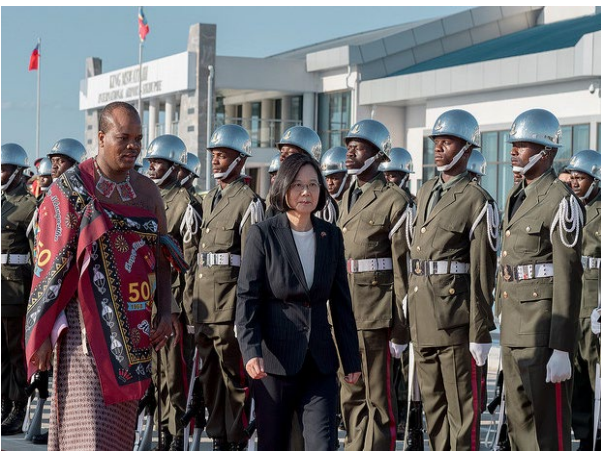
(蔡總統出訪史瓦濟蘭王國)

中華民國臺灣蔡總統英文於4月17日抵達史瓦濟蘭王國進行訪問。此行主要係參加史瓦濟蘭建國50週年及恩史瓦帝三世國王50歲生日慶典，蔡總統與恩史瓦帝三世國王進行雙邊會談，就國際局勢、兩國關係及展望，以及強化雙邊合作之倡議等雙方共同關切議題廣泛交換意見。恩史瓦帝三世國王並致贈蔡總統「象王勳章」(The Order of the Elephant)，此為史國贈予外國元首之最高榮譽，以表彰蔡總統之卓越領導及對增進兩國邦誼與合作之貢獻。