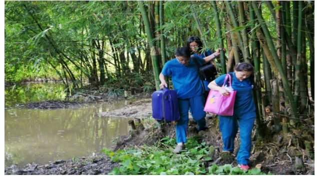
(彰化基督教醫院醫療團赴緬甸診療)

區等 20 餘國巡迴診療，計有超過 15 萬人受惠。例如聖多美普林西比原本罹患瘧疾人口高達 40%，其中幼童死亡率甚高，很多孩子根本來不及長大，父母因而沒有取名，故當地有句諺語：「只有活過 5 歲，才能擁有自己的名字」。然而自我國瘧疾防治顧問團在 2000 年投入防治工作後，不僅成功大幅降低聖國兒童染瘧率，2015 年聖國全國染瘧率更降至約 1% 且已無死亡病例