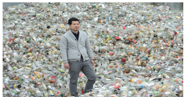
(臺灣玻璃回收率全球第二)