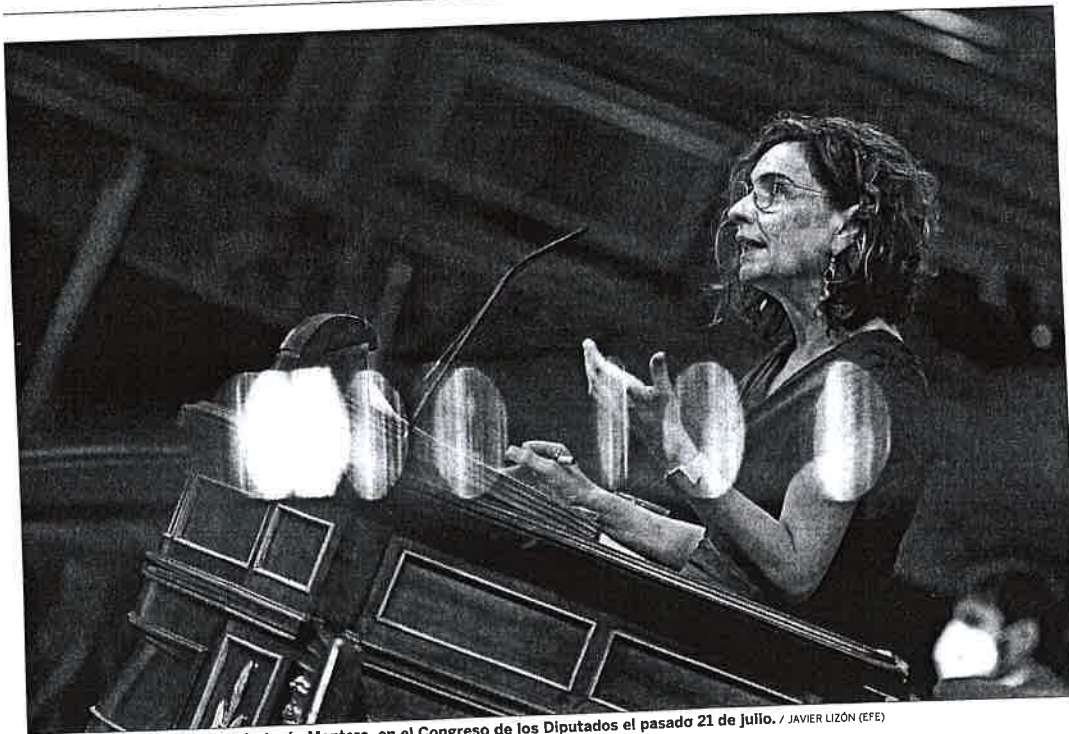
La ministra de Hacienda, María Jesús Montero, en el Congreso de los Diputados el pasado 21 de julio.