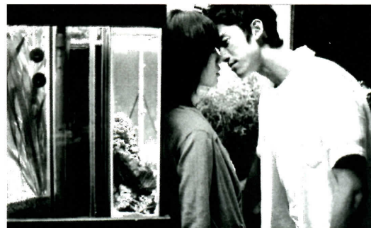
© 2017 Chi & Company. All Rights Reserved