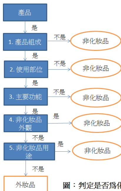
圖：判定是否為化妝品流程