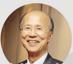
呂慶龍 監察人 前台灣駐法國代表處大使