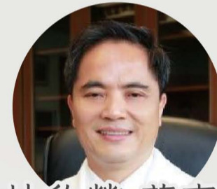
林欣榮 董事 佛教慈濟醫療財團法人 花蓮慈濟醫院 院長