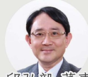
邱弘毅 董事 國家衛生研究院 群健康科學研究所 所長