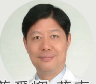
蔡爾輝 董事 行政院 政務顧問